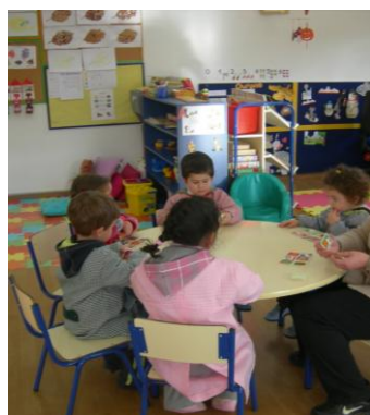
A Jogar com a Matemática!