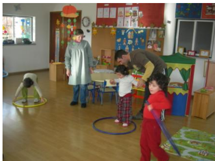
Correr, saltar e pular...há melhor do que isto?