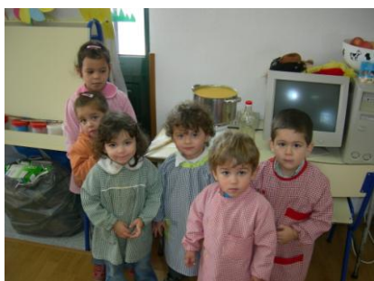
Também havemos de ser cozinheiros!