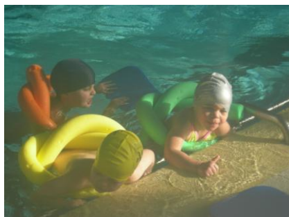
Saltamos e nadamos como os peixinhos! Não acreditam?!