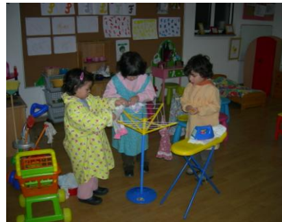
... E assim aprendemos a lavar a roupa!