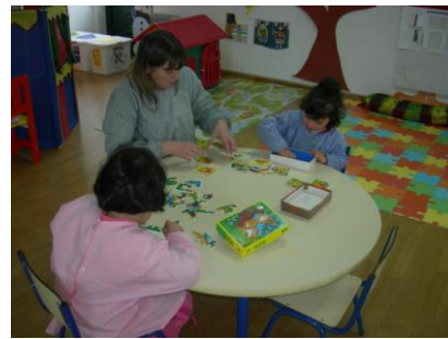
Encontrar peças e descobrir caminhos!