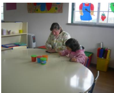
Futuros escultores é assim que começam!