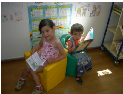
As nossas leituras estão em dia!!