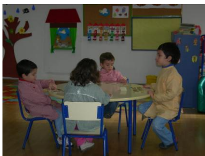
Em grupo é mais fácil e divertido!!