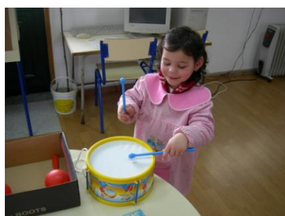
Já toco "Rock'n roll" ...!!