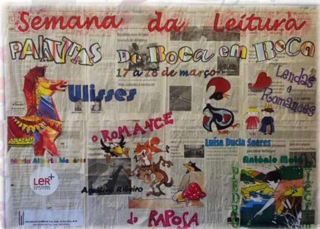
B. E. - Aquilino Ribeiro