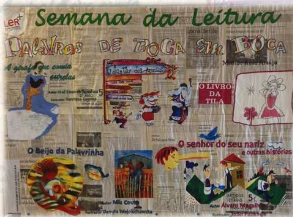
B. E. - Escola Básica